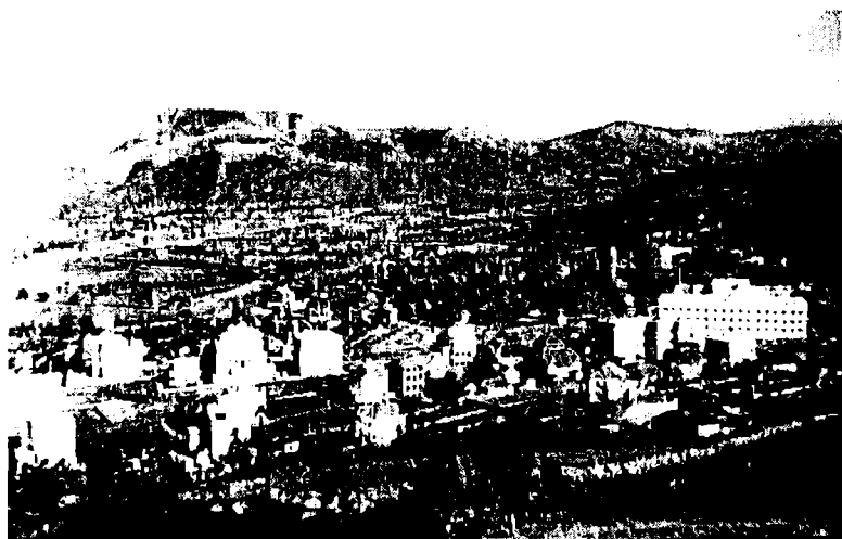
Сл. 1. – Просторни изглед новог дела Нишке Бање у међуратном периоду (снимио непознати аутор, 1938)