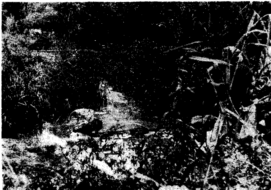
Сл. 5. Ргошкобањски термалнокрашки водоток. Истиче из ујезереног врела под раседним одсецима Болвана у Ргошкој Бањи („Бањица код Књажеца“). Приобаље је обрасло густим шеваром, трском и другом хидрофилном вегетацијом хидротермалне средине (снимио аутор: 22. VII 1978)

Капацитет изворишта Ргошкобањске реке је 40—50 литара у секунди, а преовлађујућа издашност 40,7 л/сек. 102 Као и термоминерална вода купатила, по свом хемијском саставу припада мало минерализованим хидрокарбонатно-калцијским хипотермним водама ( t = 25,5^{\circ}\text{C} ). Врело „представља место најинтензивнијег појављивања слободних гасних мехура и то по читавој површини“. Гасови избијају испрекидано у виду већих и мањих мехура, димензија и до 3 см у пречнику. Вода припада азотним термоминералним водама ( \text{N}_2 90,23%), са извесним садржајем кисеоника ( \text{O}_2 6,50%) и угљендиоксида ( \text{CO}_2 2,0% запр.) 103 И у води купатила ( 30^{\circ}\text{C} , рН — 6,8, минерализација 0,135 гр) главни елемент је калцијум, затим магнезијум, уз повећане садржаје стронцијума и умерене баријума (Ca-Mg-Sr-Ba). 104