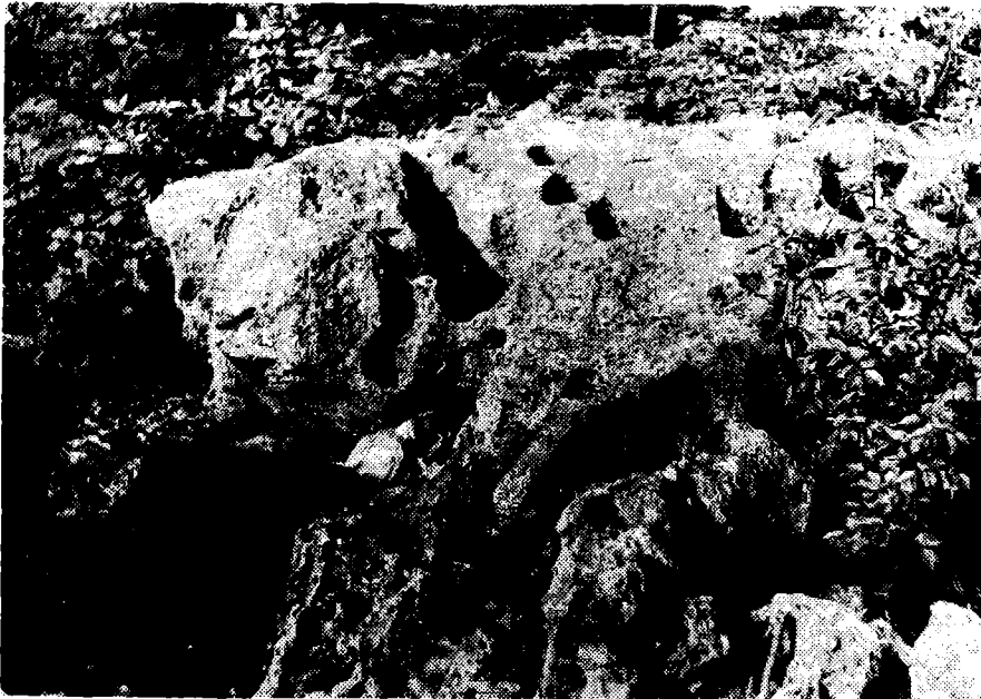
Сл. 2. Микрооблици једног фосилног термалног локалитета у бигровитом кречњаку на Бањском брду у Пећкој Бањи. У левкастим отворима су избијали гасови, а у отвору удубине термоминерална вода. У предњем плану термални шкрапари (Снимио аутор: 5. V 1978)

Нашим истраживањем откривени су и микрооблици термалног рељефа. Постоје и на сектору Угљарске Бање у области Изморника у угљарскобањском проширењу. Морфохидролошка еволуција и код Угљарске Бање била је вишестепена и у сукцесивном спуштању допрла до свог најнижег нивоа истицања; он је у речном кориту Јужне Мораве на апс. висини 510 м. Један ниво у висини око 10 м од данашњег термалног басена, на одсеку изнад прве речне терасе, пун је каверни. Ови су отвори у вертикалном низу, на простору широком око 10 м, у кречњачкој зони Фунљугит-Шпела. Око кавернозних отвора налазе се купасте гомиле постале слагањем кугличасте арагонитске конкреције као продукта ранијих топлих хидротермалних процеса. 60