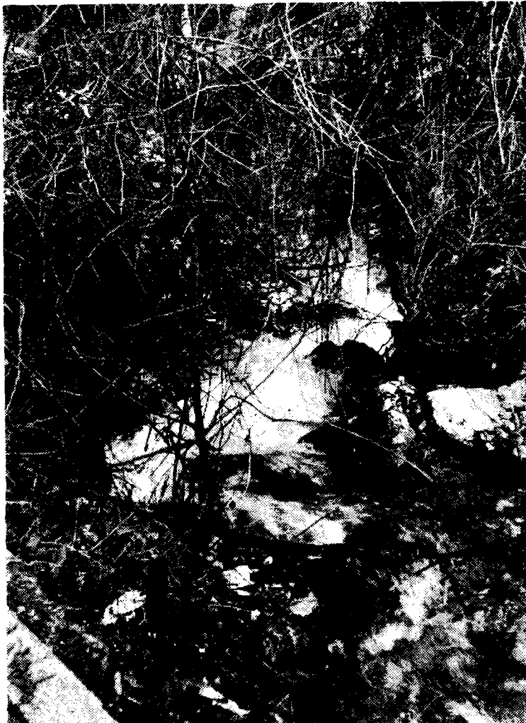
Сл. 4. Термални водоток пећинске терме у Нишкој Бањи у времену максималног протицаја (24. III 1980.)

гради ново велико и модерно купатило, као и рекреативни олимпијски базен у балнеотуристичком центру, чији је иницијални део постојећи хотел-стационар. 94