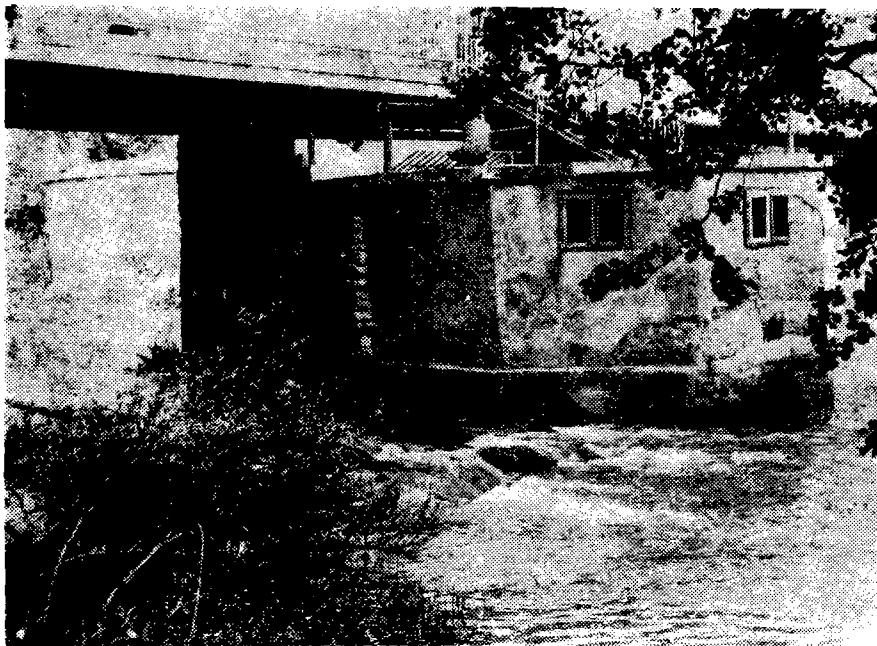
Сл. 6. Термално купатило у кориту Црног Тимока у Гамзиградској Бањи (4. VI 1978)

У Слатинској Бањи, 17 км југоисточно од Чачка, у изграђеним купатилима на обали Бањске реке или Бање, лечење се обавља углавном искоришћавањем термалних извора у водотоку. За бањска купатила сумпоровита вода температуре 15 до 17 0 С, захвата се ђермом из два ограђена извора на левој обали и у речном кориту. За оба купатила вода се греје, и у приближно подједнакој количини најпре загрејана а затим хладна минерална вода, спроводи у каде купатила где се воде различите топлоте мешају за купање. Ова је бања у народу на гласу и по лековитости за ране које се тешко лече и туберкулозна обољења костију. 121