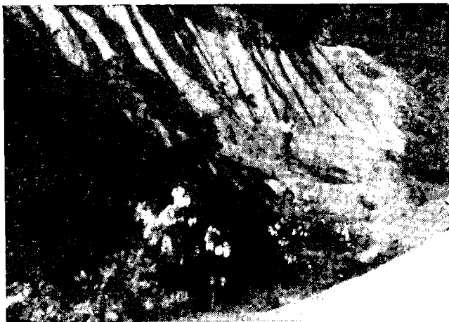
Сл. 1. — Урве на источној падини Шембрунског брега

Највећи и најчешћи облици ерозије тла су јаруге. Као и раније поменути облици, и јаруге су усечене обично у растресити покривач. Њихове димензије су различите. Таква дужина јаруга може бити од неколико десетина метара па до 1—2км., а дубине и до 10м.